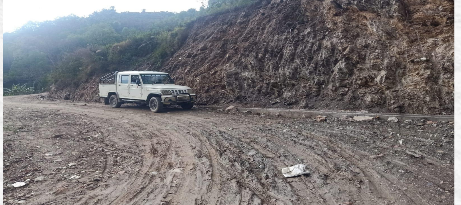
भोटेफाट खासुरबेसी खासुर सडक स्तरोन्नति, बेसीशहर नगरपालिका वडा नं १०