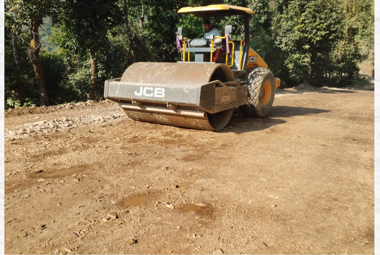
धुरपुरे-दुइथोक-बिम्दा-बाख्रेजगत-नाल्मा सडक स्तरोन्नति कार्य