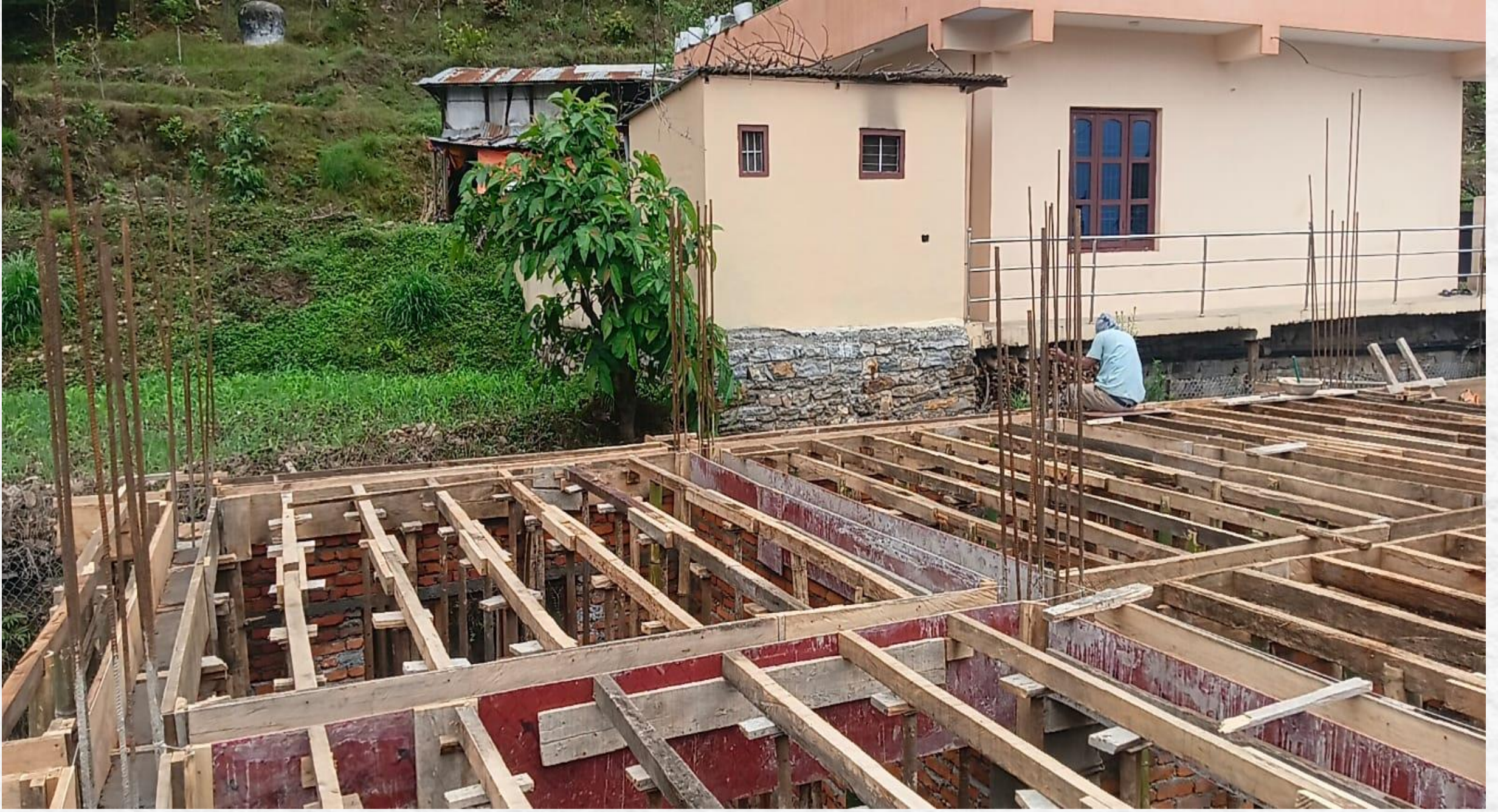
वडा कार्यालय भवन निर्माण, वडा नं १०