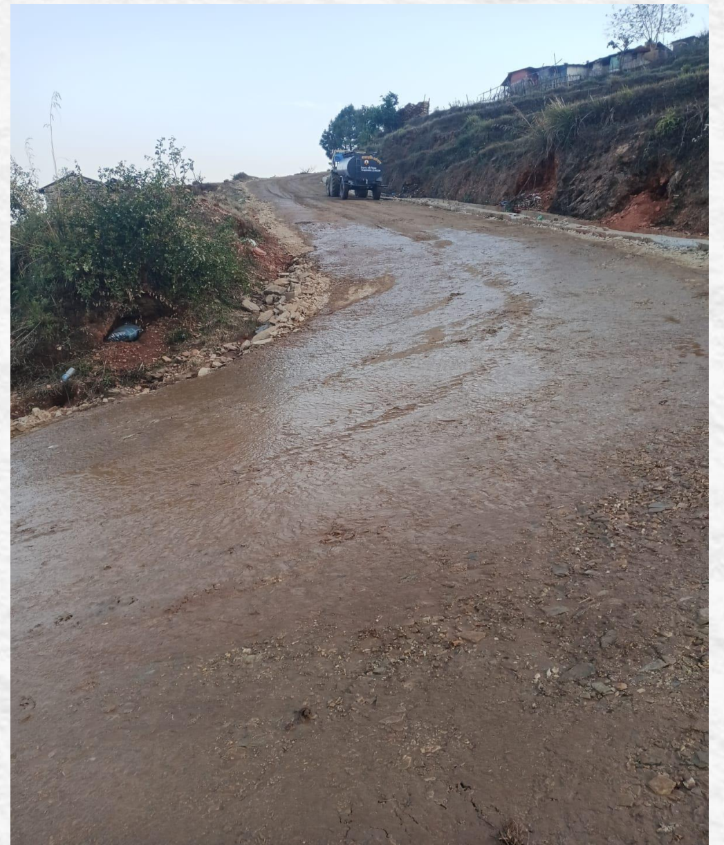
रानीकुवा गाउँशहर नाल्मा हुँदै लक्ष्मिबजार सडक निर्माण/ स्तरोन्नति कार्य

प्रकाशक: बेसीशहर नगरपालिका, नगरकार्यपालिकाको कार्यालय, बेसीशहर लमजुङ