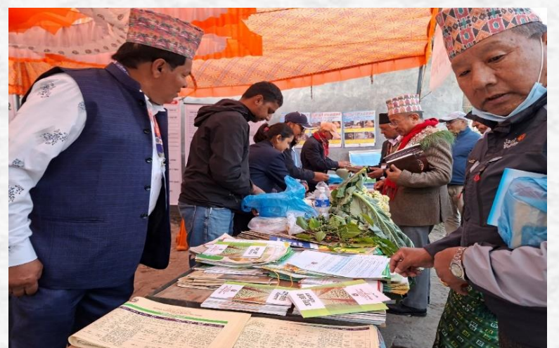
कृषि विकास शाखाबाट प्राविधिक सुझाव तथा सल्लाह उपलब्ध हुने विषयहरू