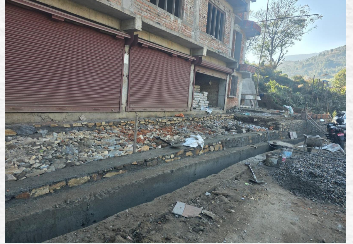
बि. पि. स्मृति भवन निर्माण/ स्तरोन्नति कार्य, बेसीशहर नगरपालिका वडा नं ८