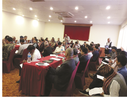
काठमाण्डौमा आयोजित सुभाब तथा विचार संकलन गोष्ठी