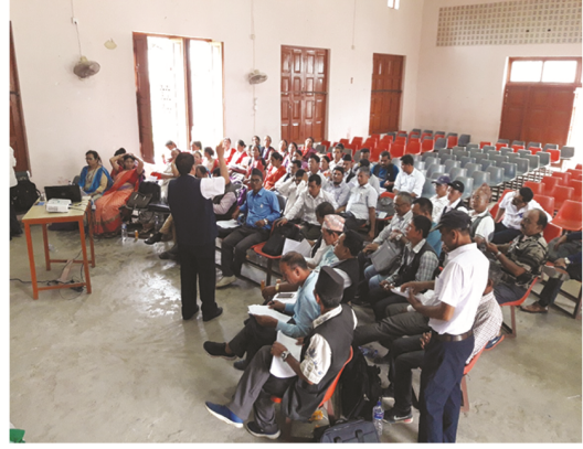
तेश्रो नगरसभाको बन्दसत्रमा उपस्थिति नगरसभासदज्यूहरू