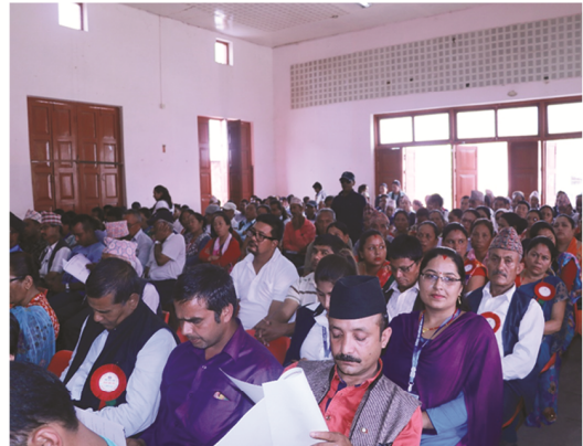
तेश्रो नगरसभाको उद्घाटन समारोहमा उपस्थित अतिथि महानुभावहरू