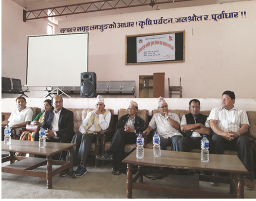
बेसीशहर नगरपालिकाका बुद्धिजीवि, समाजसेवी, व्यवसायीहरूसंगको योजना तर्जुमा सम्बन्धी सुभाब संकलन कार्यक्रम